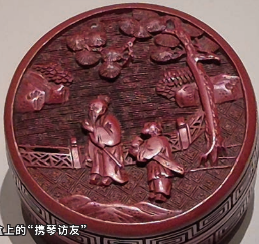
剔红圆盒上的“携琴访友”