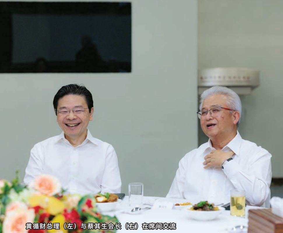
黄循财总理（左）与蔡其生会长（右）在席间交流