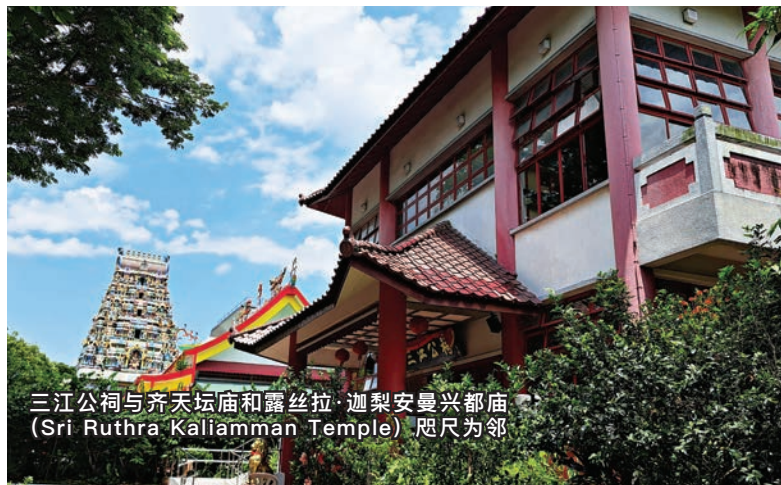
三江公祠与齐天坛庙和露丝拉·迦梨安曼兴都庙（Sri Ruthra Kaliyamman Temple）咫尺为邻