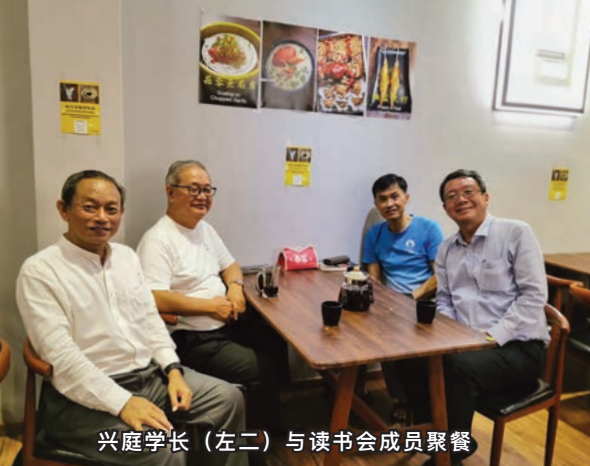
兴庭学长（左二）与读书会成员聚餐