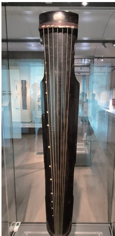
专家考证，此为北宋理学家邵康节（邵雍）的仲尼式古琴