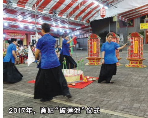
2017年，斋姑“破莲池”仪式