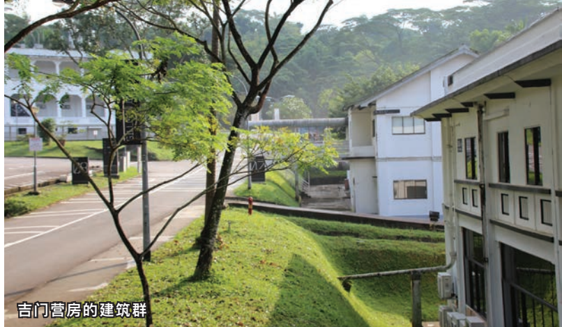
吉门营房的建筑群

法庭。负责审理的朱星法官幽默地说，虽然两人住在友谊山，但长久以来彼此之间一点都不友善。他判处向对方丢石子的一方罚款10元。