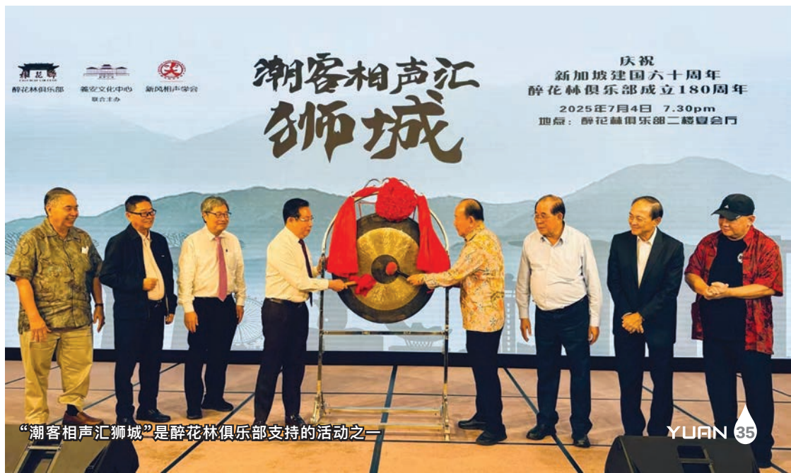
“潮客相声汇狮城”是醉花林俱乐部支持的活动之一