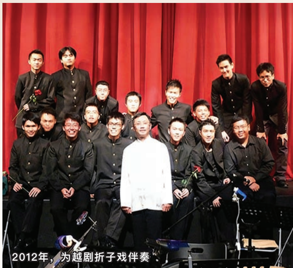
2012年，为越剧折子戏伴奏

加坡红十字会等。2015年3月担任在新加坡国际会议中心举行的“我们的新谣演唱会”全场指挥。2015年7月也受邀为新加坡笛子节音乐会客卿指挥，2016年9月指挥武装部队华乐团在滨海艺术中心举办的“艺满中秋”，呈献3场以黄梅调和越剧为主的音乐演唱会。2018年1月受邀为新加坡笛子协会举办的新年音乐会呈献独奏节目。