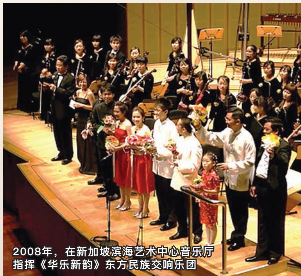
2008年，在新加坡滨海艺术中心音乐厅指挥《华乐新韵》东方民族交响乐团