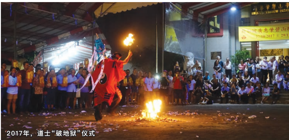
2017年，道士“破地狱”仪式