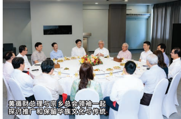
黄循财总理与宗乡总会领袖一起探讨推广和保留华族文化与传统