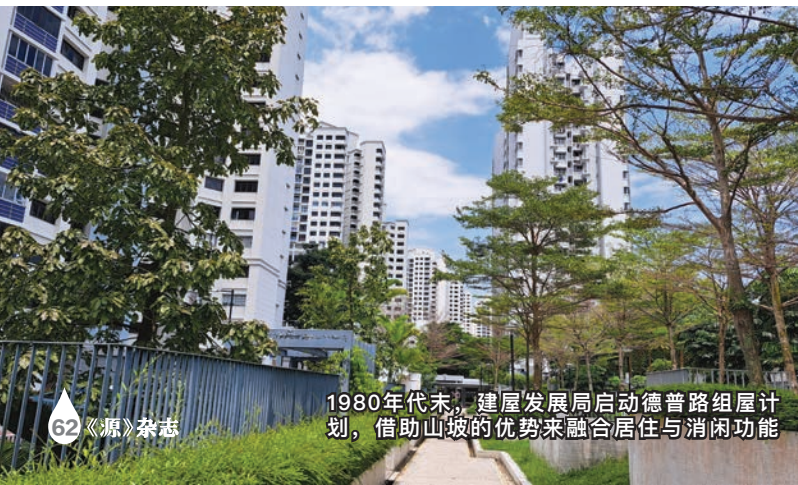
1980年代末，建屋发展局启动德普路组屋计划，借助山坡的优势来融合居住与休闲功能