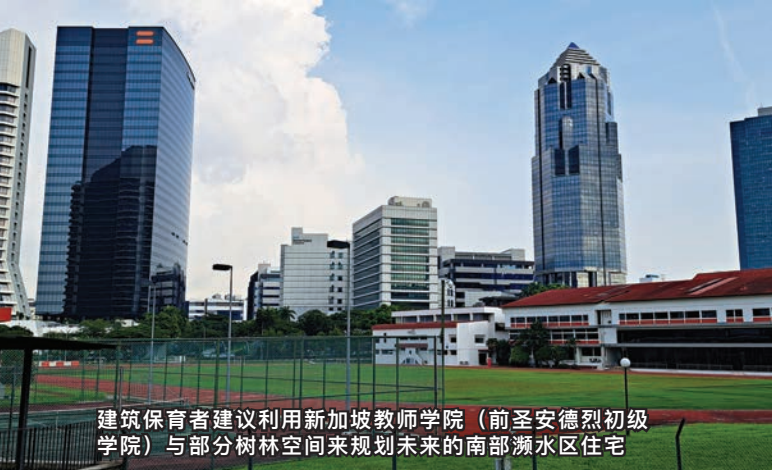
建筑保育者建议利用新加坡教师学院（前圣安德烈初级学院）与部分树林空间来规划未来的南部瀕水区住宅