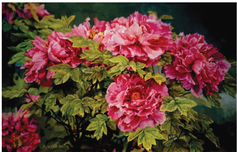
李文彦作品《牡丹》布面油画 59X90cm (1995)

17至18世纪，花卉画在荷兰和佛兰德斯地区（或称西属尼德兰）尤为繁荣，被称为“荷兰黄金时代的花卉静物画”。彼时画家以极其惊