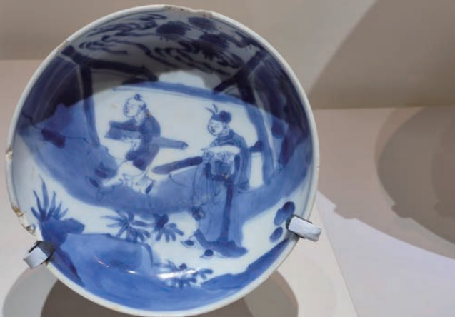
青花瓷盘上，抱琴侍童随着寻访知音的主人前行