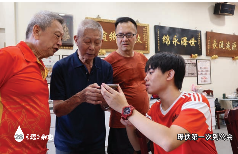
璟佚第一次到公会