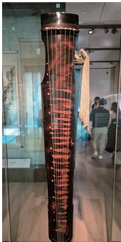
明代的仲尼式古琴“秋声”