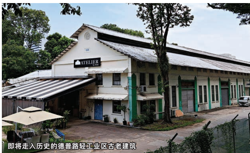
即将走入历史的德普路轻工业区古老建筑

技局楼（Defence Technology Towers），这里就是昔日军需库的原址。笔者服役时，曾带领后勤人员到此领取弹药；从事正业时亦在此上过班，见证时空的变化。