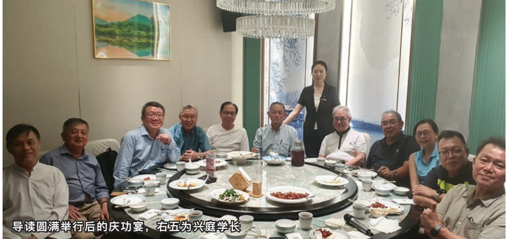
导读圆满举行后的庆功宴，右五为兴庭学长