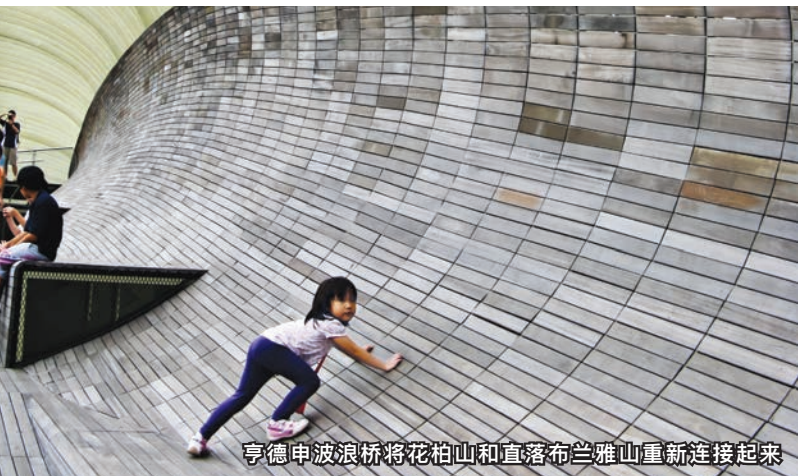
亨德申波浪桥将花柏山和直落布兰雅山重新连接起来

吉门营房旁的普勒士顿路（Preston Road），有个消失的友谊山（Friendly Hill）民宅。虽然地名称为“友谊”，但由于居住空间有限，容易引起邻里纠纷，居民曾为了芝麻绿豆之事而闹上