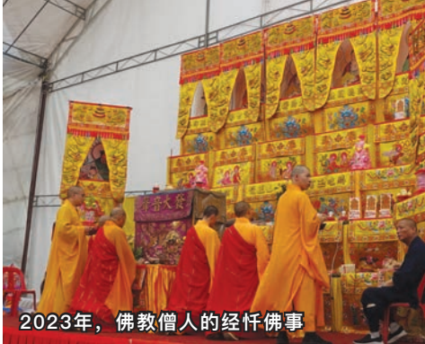
2023年，佛教僧人的经忏佛事

1990年代以后，碧山亭的领导，积极推动碧山亭成为本地华人敬宗追源，以及弘扬华族文化的中心。因此，把万缘胜会从非常规性的仪式活动，改为五年一届的常规活动，从而得到固定的收入来源，作为推动碧山亭作为仁孝的儒家文